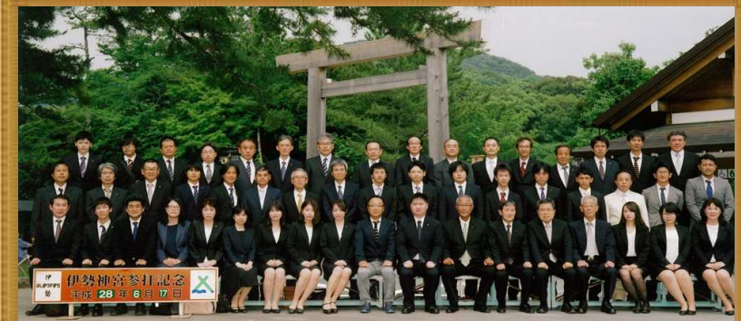
(株)ワールド測量設計 平成28年度社員旅行