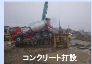
コンクリート打設